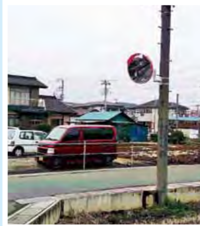
青柳8丁目：交通看板設置